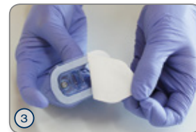
③ Tyvek-Folie des Innenblisters abziehen