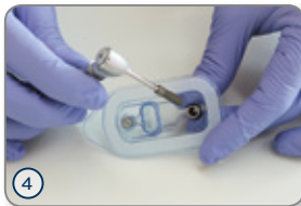
④ Eindreh Schlüssel direkt ins Implantat einführen und entnehmen