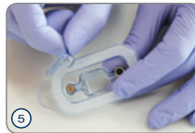
⑤ Schutzdeckel für Einheitschraube abnehmen