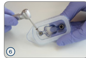
⑥ Einheitschraube mittels Eindreh Schlüssel entnehmen